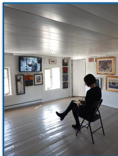
Artiste sur la photo: Aimée Lévesque

À noter que les résidences et leurs présentations font partie intégrante de la programmation du Marathon de la création , qui sera dévoilée ultérieurement.